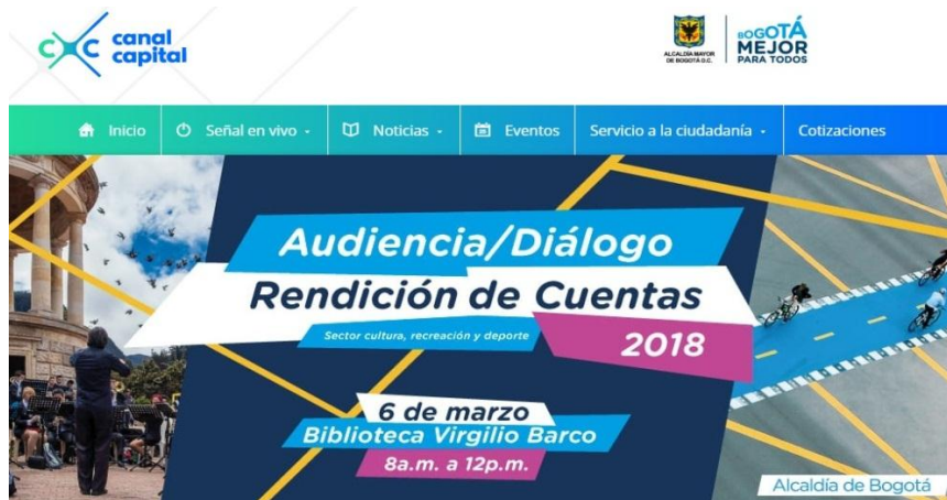
Banner en la página web de Canal Capital.